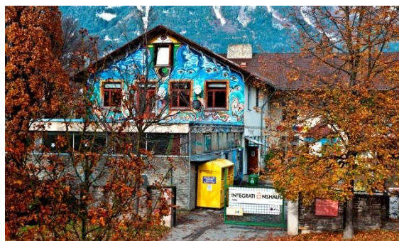
🍁 Hearst Herbert, herrlich wie es herbstet!!! 🍁

Genießen Sie Ihre Zeit mit uns im Integrationshaus 2 x wöchentlich warmes Essen von 19-21 Kulturprogramm bis 22 für Mitglieder und Freunde