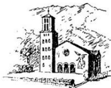
Grafik: Pfarre Neu-Pradl

Gumpstrasse 67, 6020 Innsbruck Buslinien C F H ⇒ H Schutzengelkirche